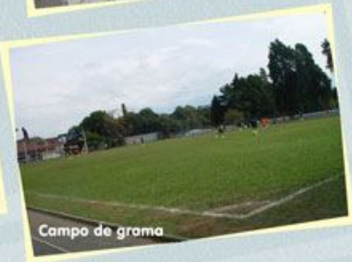
Campo de grama