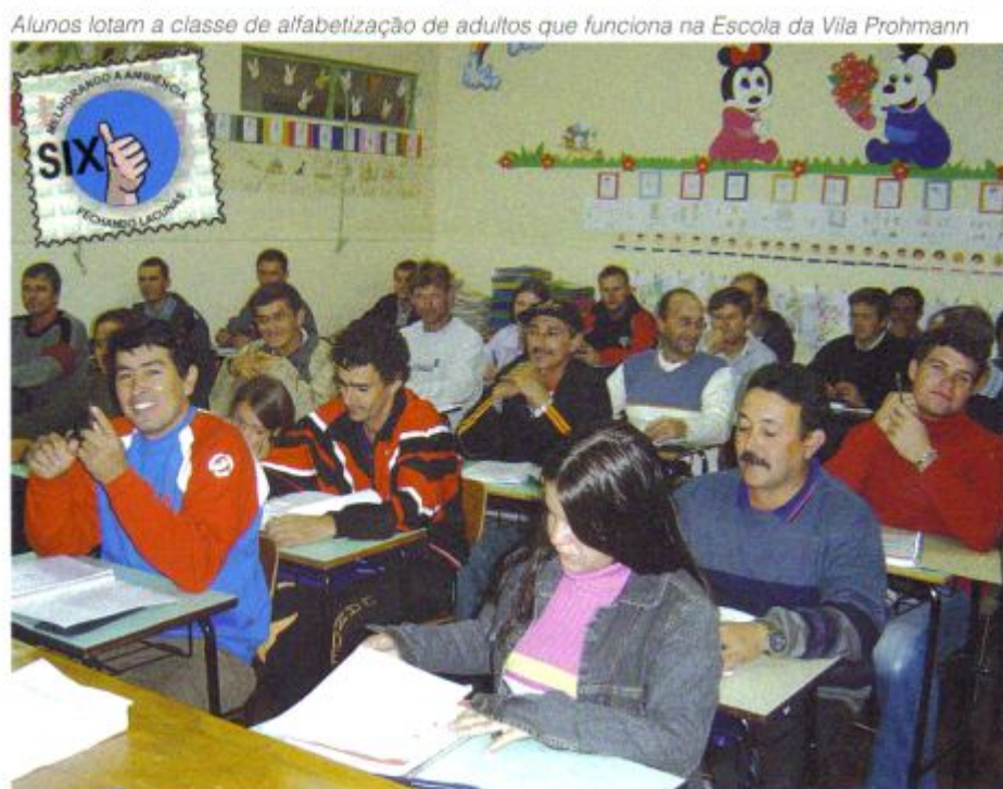
Alunos lotam a classe de alfabetização de adultos que funciona na Escola da Vila Prohmann

O programa é uma parceria entre a SIX e a prefeitura de São Mateus, que cede o espaço físico. Nossa Unidade oferece transporte, material didático, lanche, entre outras responsabilidades, e arca com os custos do contrato com o Sesi (Serviço Social da Indústria), responsável pelas aulas.